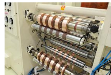
銅箔スリット加工