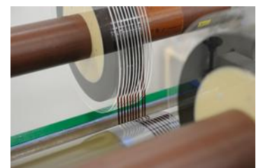
マイクロスリット加工