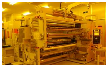
クリーンスリット加工 (イエロールーム内)