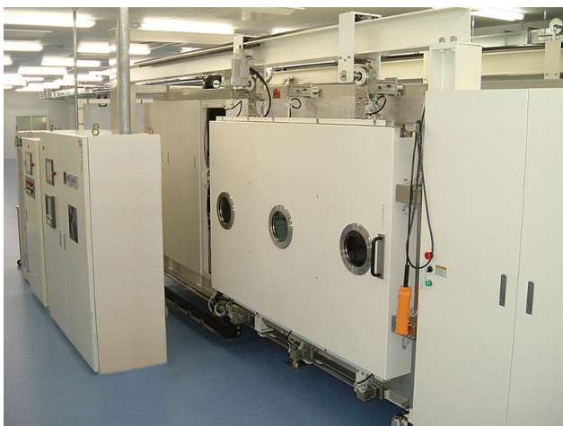
スパッタリング装置外観